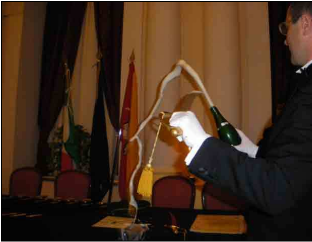
L'arte del sabrage al Grand Hotel Villa Politi di Siracusa

La locandina della maestosa serata di adesione alla Confrérie del Grand Hotel Villa Politi