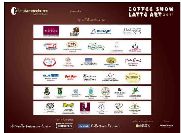
Tutti i loghi dei partecipanti all'evento regionale Coffe Show