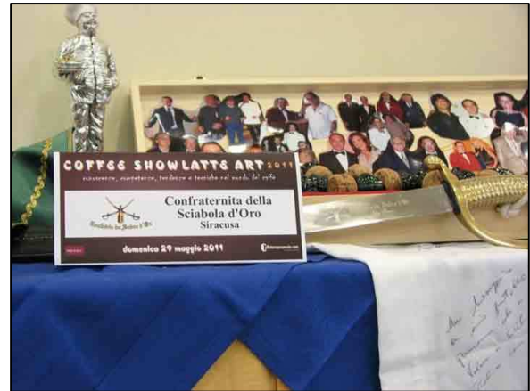
Angolo del desk dedicato alla Confrérie