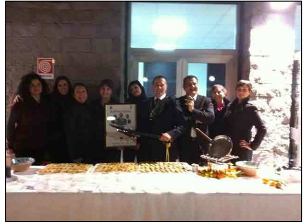
L'arte del sabrage debutta nella città di Ragusa