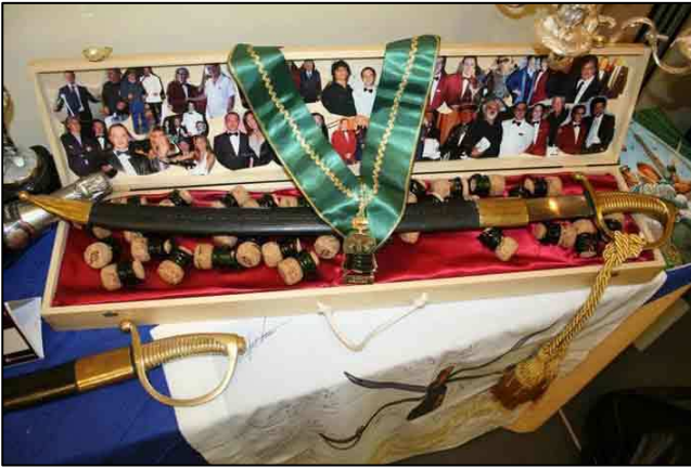
Insegne e cimeli della Confraternita della Sciabola d'Oro