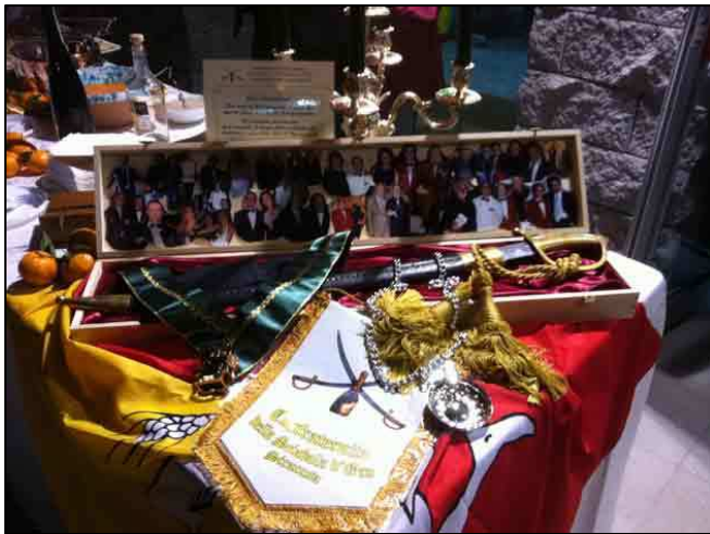
L'arte del sabrage debutta in Val di Noto